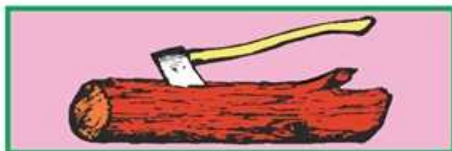
Distintivo de Formador